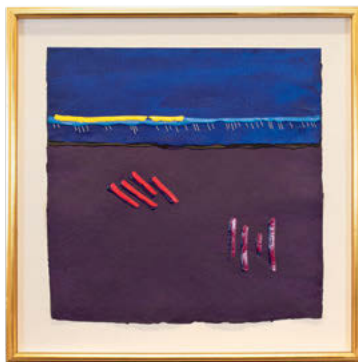
Robert Houle. Parfleche #4, Simon , de la série Parfleches for the Last Supper , 1983. acrylique, plume de porc-épic sur papier, 56 x 56 cm. Collection du Musée des beaux-arts de Winnipeg. Don de M. Carl T. Grant, Artvest Inc., G-86-463.

AV-É2 L'apprenant développe sa compréhension de l'impact et de l'influence des arts visuels.