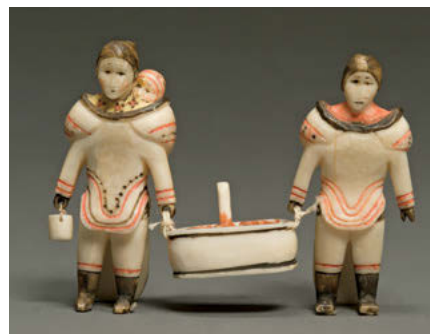
Artiste inconnu. Deux femmes transportant de la viande dans un baquet, 1892–1901. ivoire, colorant noir, colorant rouge, colorant jaune, ficelle, 5,4 x 7,7 x 1,5 cm. Collection de la Winnipeg Art Gallery; The Cotter Collection, acquis grâce aux fonds d'un donateur anonyme, G-91-6.

AV-É2 L'apprenant développe sa compréhension de l'impact et de l'influence des arts visuels.